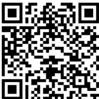
KIA Gevangenen Pastoraat